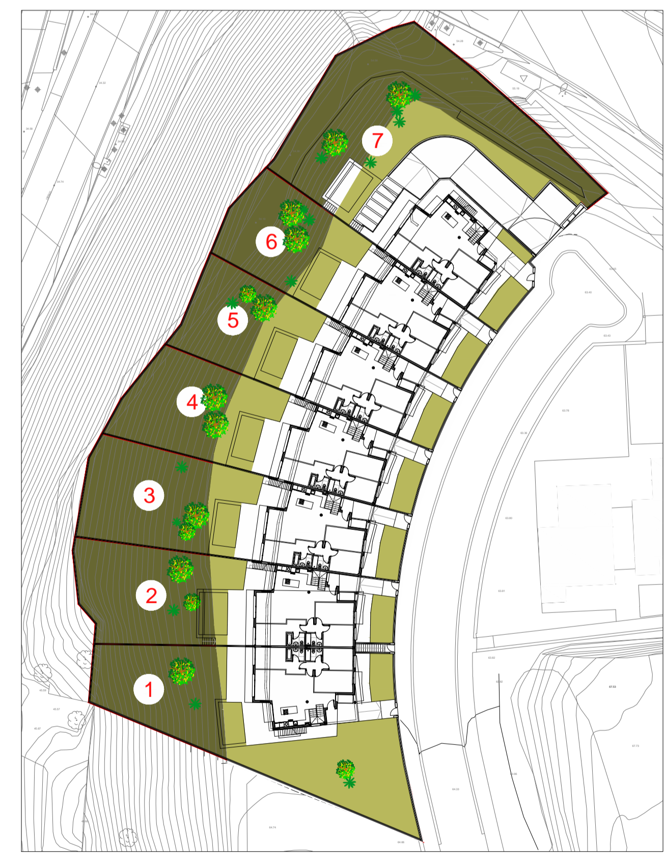
VIVIENDA 3 a 6. COTAS y SUPERFICIES