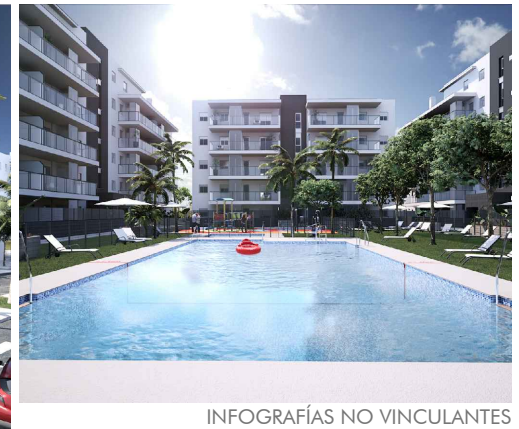
INFOGRAFÍAS NO VINCULANTES

EL PRESENTE DOCUMENTO ES DE CARÁCTER INFORMATIVO Y PODRÁ EXPERIMENTAR VARIACIONES POR EXIGENCIAS TÉCNICAS, JURÍDICAS Y/O EXIGENCIAS MUNICIPALES. LAS SUPERFICIES EXPRESADAS SON APROXIMADAS, PUDIENDO EXPERIMENTAR MODIFICACIONES POR RAZONES DE ÍNDOLE TÉCNICA EN EL DESARROLLO DE LA EJECUCIÓN DE LAS OBRAS. LAS DIMENSIONES DE PILARES, SITUACIÓN DE BAJANTES Y CONDUCTOS DE VENTILACIÓN AL IGUAL QUE LAS DIMENSIONES Y POSICIÓN DE HUECOS NO ES DEFINITIVA. LOS GIROS DE PUERTAS Y LA DISTRIBUCIÓN DE LOS APARATOS SANITARIOS Y ELECTRODOMÉSTICOS DE LAS COCINAS NO SON VINCULANTES. EL MOBILIARIO ES SOLAMENTE A TÍTULO INFORMATIVO. ESTE DOCUMENTO NO TIENE VALOR CONTRACTUAL