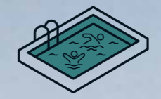
Piscina comunitaria en planta ático

Tu casa se convertirá en el lugar ideal donde desarrollar tu vida sin preocupaciones, con la combinación perfecta entre zonas comunes, lugar tranquilo y desarrollo urbano.