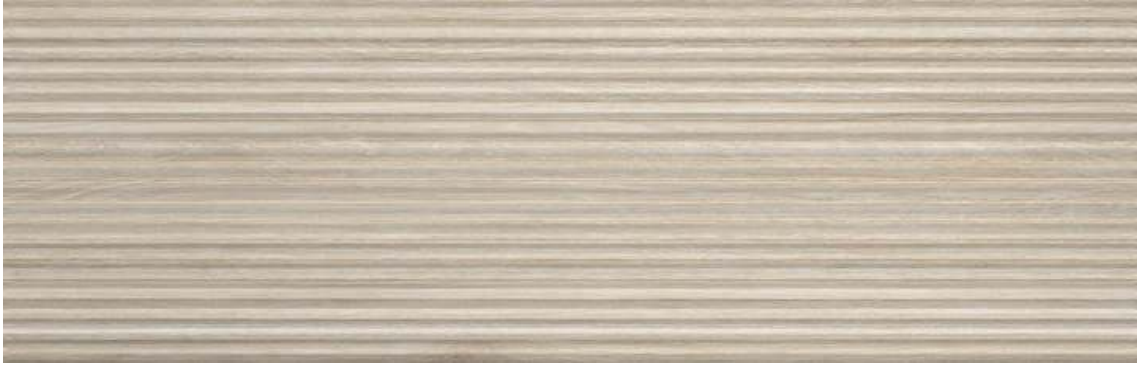
SUITE ABBEY ROBLE3 0 X 90 cm (REVESTIMIENTO VERTICAL)