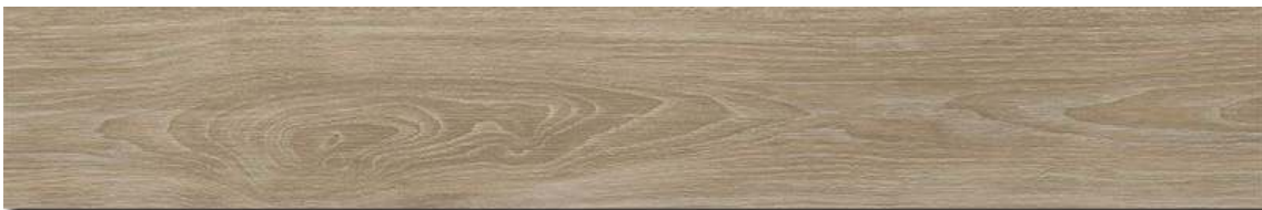
ABBHEY ROBLE 19.5 X 120 cm (SUELO)