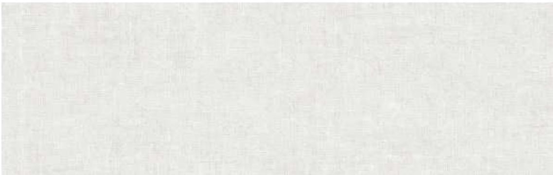
DENIM BLANCO 31.5 X 100 cm (REVESTIMIENTO VERTICAL)