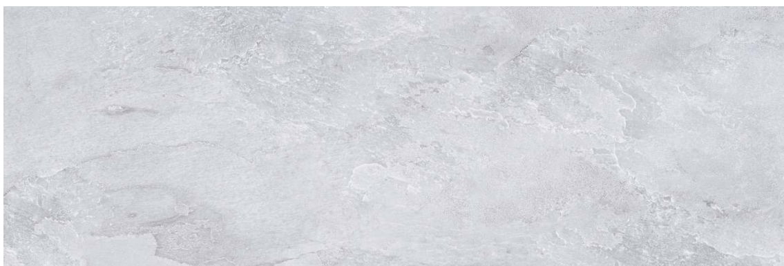
NATURE GREY 30 X 90 cm (REVESTIMIENTO VERTICAL)