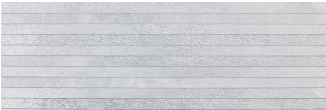
NATURE CONCEPT GREY 30 X 90 cm (REVESTIMIENTO VERTICAL)