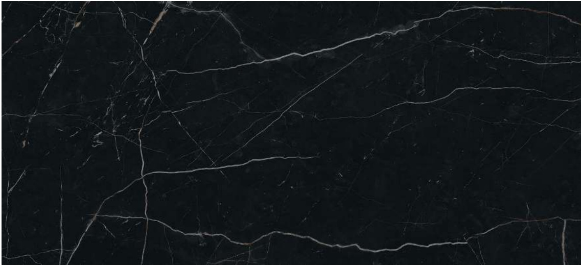
MARVEL BLACK ATLANTIS LAPPATO 50 X 110 cm (REVESTIMIENTO VERTICAL)