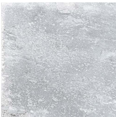
NATURE GREY60 X 60 cm (SUELO)